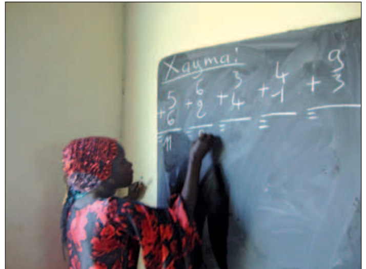
Dette bilete er teke frå undervisninga i november 2010.

Når dette som «ikkje går på skinner» no er halde fram, så må