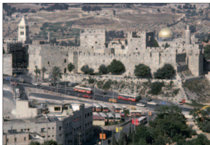
– Kvifor dette hatet mot jødane og Israel? Den grunnleggjande tankegangen finn me i Koranen. Der er det ikkje mykje å hente for jødane, skriv Hallgrim Berg i Lys over Land .

Men sjå også på den praktisk-politiske situasjonen i Midt-austen: For herskarane og dei privilegerte gruppene på toppen i dei arabiske oljestatane, der folket lever i sosialt elende, i analfabetisme og vankunne, med sensur og hjernevask sett i system, er det beintfram farleg å ha eit Israel gåande: Det er jo eit utstillingsvindauga for modernisme, opplysning, utdanning, deltaking, folkestyre, velferd, likestilling mellom mann og kvinne, med gode kår for minoritetane osv. Nei, det er skummelt å ha slike utstillingsvindauga som Israel i nærleiken. I tillegg har dei i Israel det verste av alt – yringsfridom og organisasjonsfridom. Alt dette kan koma til å setja «grillur» i hovudet på folk, og dermed undergrava dei arabiske elitane sine ufattelege eigedomar, privileg og maktposisjonar.