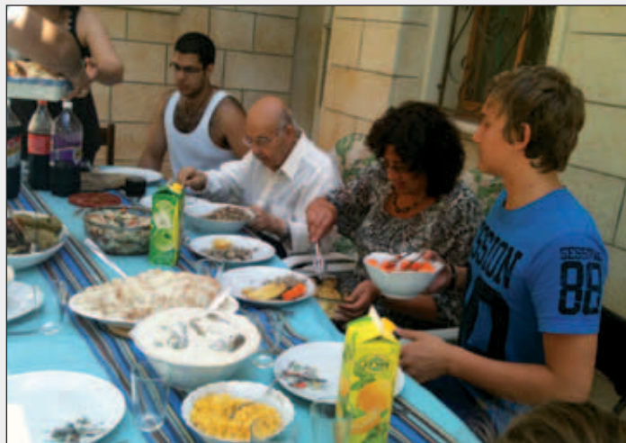
Deilig middag hos Daed.