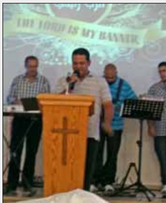
Fra møte i Kirka.